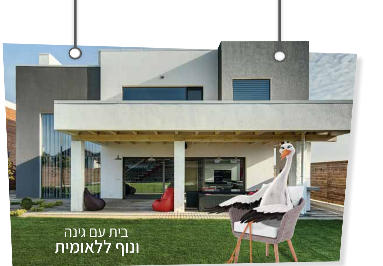
בית עם גינה ונוף ללאומית