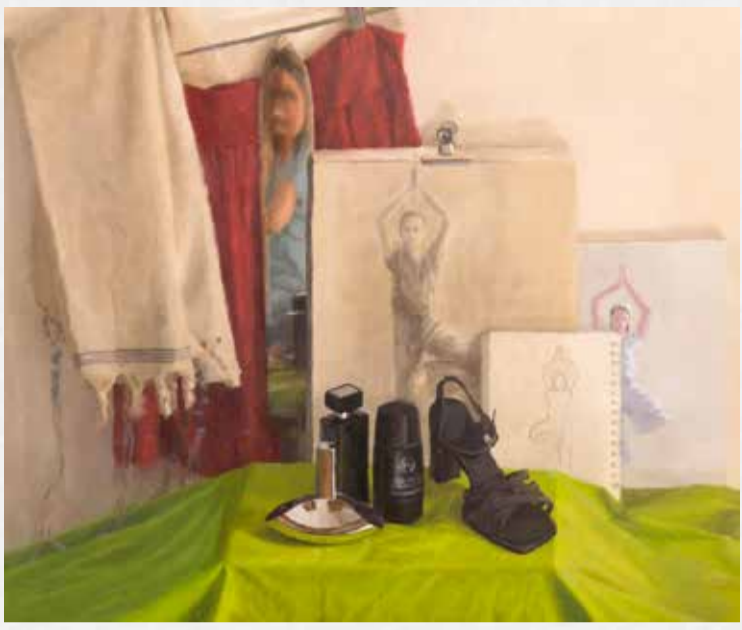
אומנות קפה שפירא - יצירות אומנים לאומיים חני כהן זדה, ידיעת ההכפים היא אחת.