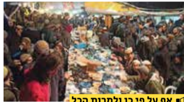
אף על פי כן ולמרות הכל

במבצע חשאי מאורגן צעדו הערב בחסות החושך 1,200 תלמידי ישיבות דרך כפרים ערביים והגיעו לחומש למרות המצור הצבאי שסוגר במנהלך את הכניסה לצפון השומרון, הם חוגגים כעת סדר ט"ו בשבט עם תלמידי ישיבת חומש.