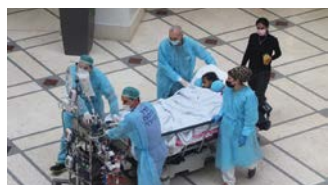
ללמוד להעריך גם קרן אור אחת קטנה.

ילדה בת 11 המטופלת ביחידה לטיפול נמרץ לב ומחוברת יותר מ-40 יום לאקמו (מערכת המחליפה את פעולת הלב והריאות) ביקשה מהצוות לצאת קצת לשמש. ברגע שהפציעה השמש מבין העננים התארגן הצוות המטפל (רופא, אחות ומפעילי מכונת לב ריאה) ובמאמץ משותף לקחו אותה להנות מהאור. כולנו תקווה שהיא תחזור לאיתנה ושהקרניים המחממות יעזרו לה להבריא! ♥