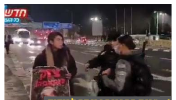
זכות ההפגנה נכנסה לבידוד

ממה הם מפחדים? למה נערה שמממשת את זכות המחאה שלה סופגת אלימות משוטרים? עד מתי סתימת הפיות תמשך?